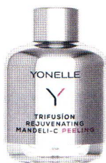
Piling z kwasem migdałowym Yonelle Trifusion, 50 ml, 199 zł