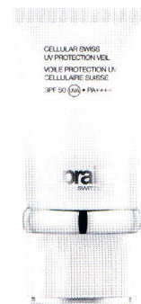
Emulsja ochronna La Prairie Cellular UV Protection Veil SPF 60, 50 ml, 749 zł