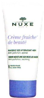
Maska nawilżająca Nuxe Crème Fraîche de Beauté, 50 ml, ok. 85 zł